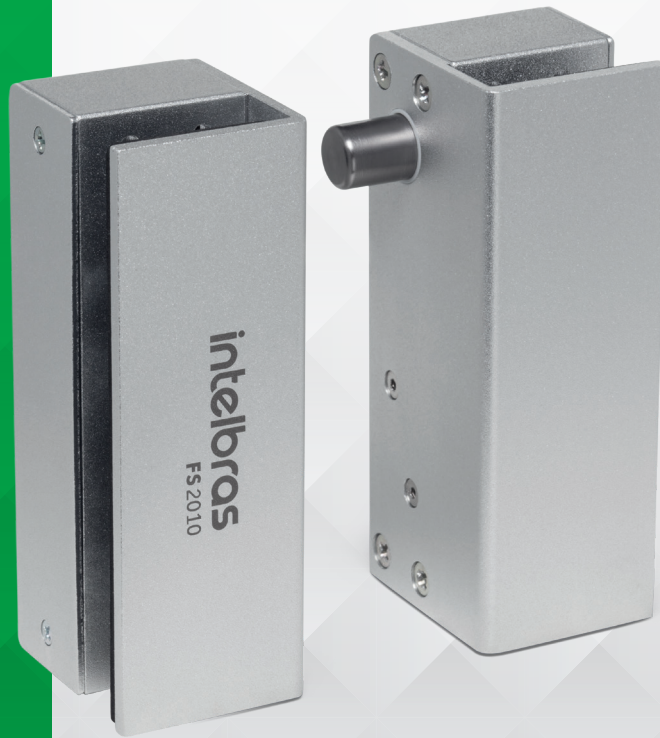
Fechadura solenoide para portas de vidro