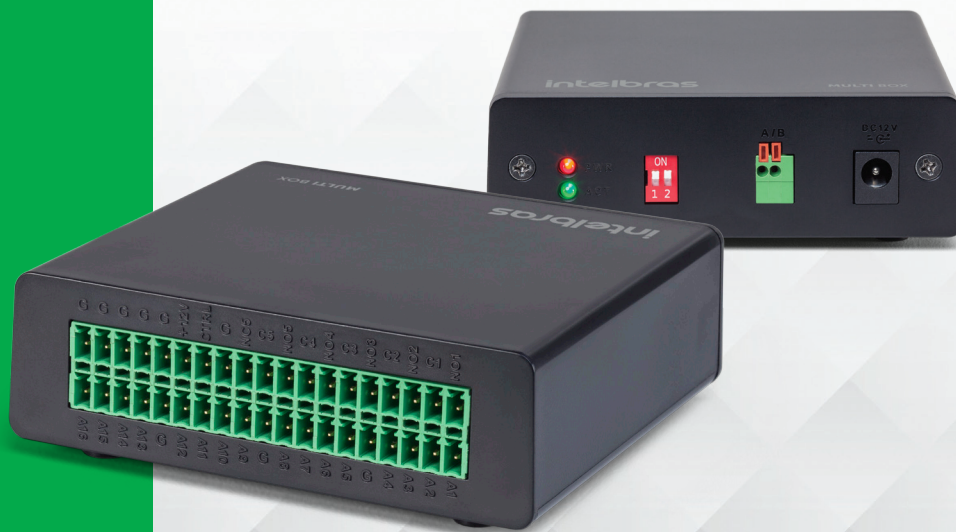
Módulo expensor de entradas e saídas de alarme para DVR