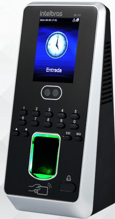
Controlador de acesso