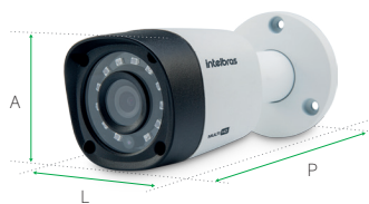
VHD 3120 B G4 / VHD 3130 B G4