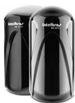
Sensores de barreira IVA 3070 X / IVA 3110 X