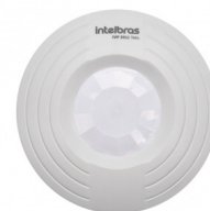
Sensor para instalação em TETO IVP 3011 TETO